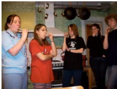
Tand trolen får sig en sista törn innan nattning.