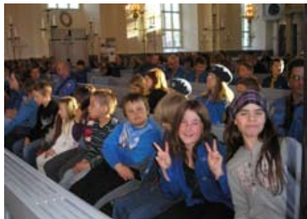
Sätters scouter i kyrkan