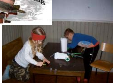
Juniörerna var bar två men båten flöt bra ändå.