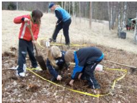
Rutan skulle röjas och rostig spik finnas.