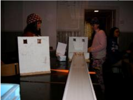
Kanalen från nålens syn vinkel.