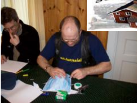
Årets konstruktions tävling var förlagd till marin miljö. Ledar laget kämpar febrilt med att sänka brutto tonnage.