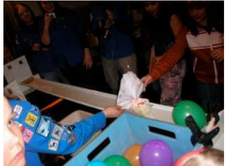
Kungliga Ängla Expressen flyter bra fast varför sliter matroserna i seglen?