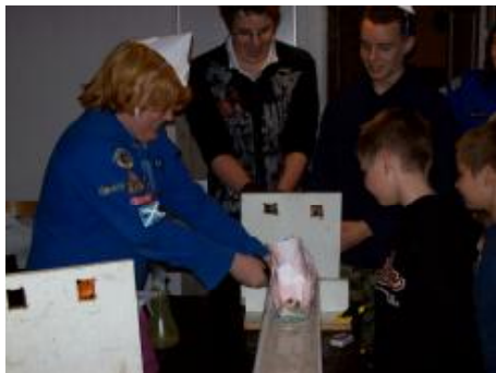
Patrull har visa problem med att botten på kanalen ligger aldelens för nära skrovet.