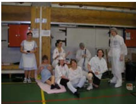
"Säters Sjukhus" Patienter, labbkillar, sjuksyster och överläkare