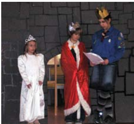
Sankt Georg framträdande i kyrkan