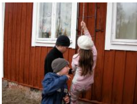
Rep klättring går lättare om man har ett tunnare hjälp rep runt huvud repet.