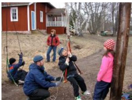
Med lite utväxling går det lätt uppför. Men vad var det för skillnad på block och talja?