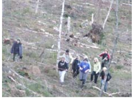
Patrullscouterna letar efter utrustning som släppts med fallskärm.