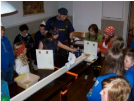
Minior Båten har fått en bra start och har snart nått de främre vatten gluggarna