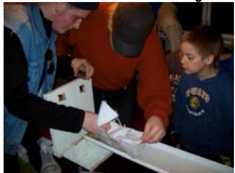
Venjan visar hur man sjö sätter en vinnande skuta.