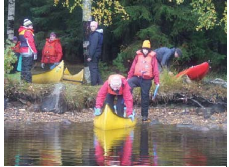
Ett riskfyllt moment, att lyckas sätta sig i Kvar, en väldigt instabil kanot.