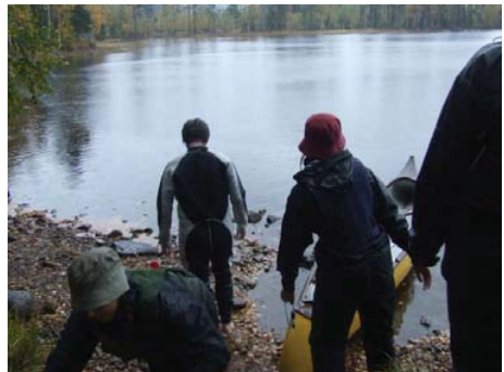
Vad gör man när regnkläder inte räcker till? Använd våtdräkt!