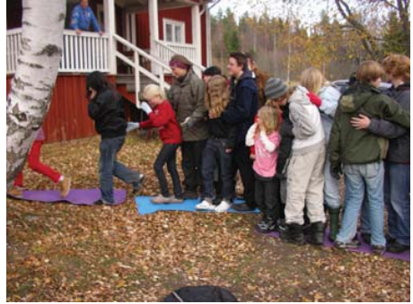
Efter som Radio Amatörerna inte kunde delta under årets JOTA anordnades i stället en skogs fem kamp.