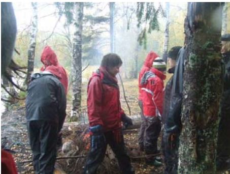
Kan det vara bättre att vänta här?