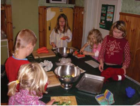
Juniorerna förbereder Lunchen.