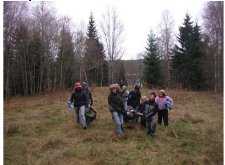
Bårbärning över ängen gick bra ända tills en bår gick av.