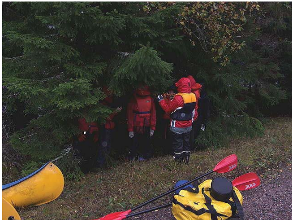
Väntan på start, stå mitt i kläderna!

Att lägga en kanothajk i slutet på september är ganska chansartat, det kan vara jättefina dagar men det kan också vara mindre fina dagar. Vi fick det senare, vi startade i +5°, motvind och konstant duggregn. I regnet och motvinden var det inte helt lätt att hålla kanoterna på rätt kurs, fick man in vinden lite snett framifrån slutade det ofta med en "bredsladd" med kanoten. Under kvällen så klarnade vädret upp, och på söndagen hade vi riktigt bra väder (åtminstone jämfört med lördagens väder).