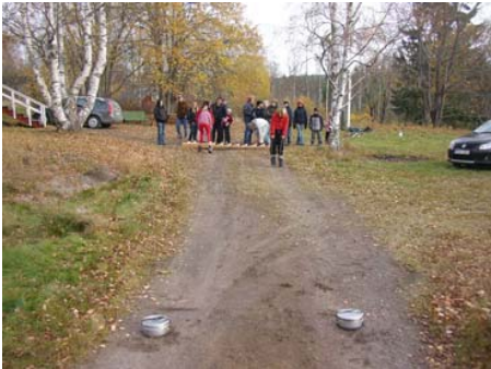
Styltgång och Trangia montering