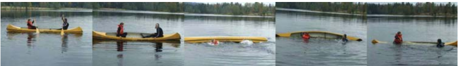
Therese och Ester övar på att tippa kanoten.