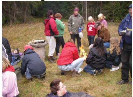
Näst sista grenen var vatten värmning medels telefon katalog.