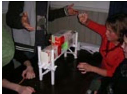
En vinnar bro klarade 7st 1,7liters mjölkförpackningar.