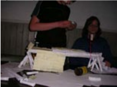
Gamarnas prakt bro