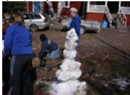
Söndagen startade med organisations tävling.