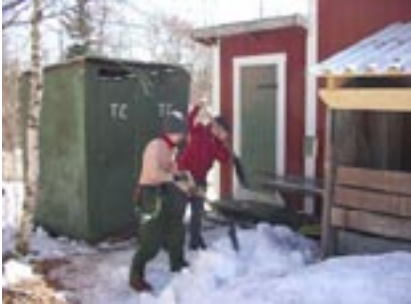
Seniorerna arbetade hela lördagen med att frigöra en väg till dasset.