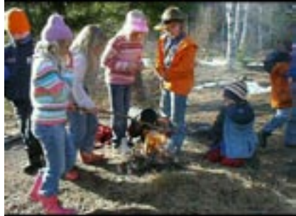
Eid kontrollen startade med rör eldning innan det blev dags att bränna popcorn.