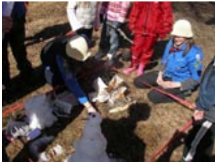
Snö gubbar och eld inom rutan men hur transformerar man en läsk burk till en öl burk.