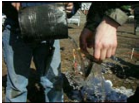
Patriks vatten hjul