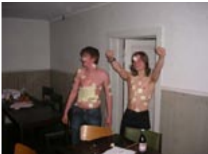
säkraste sättet att använda post-it blocket om man vill vara med i Draken.