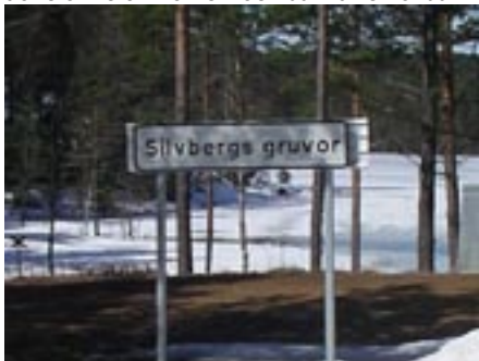
Sen bar det av genom snön upp till Silvberg för ST:GEORGE firande.